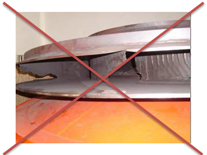
Знос на лопастях рабочего колеса